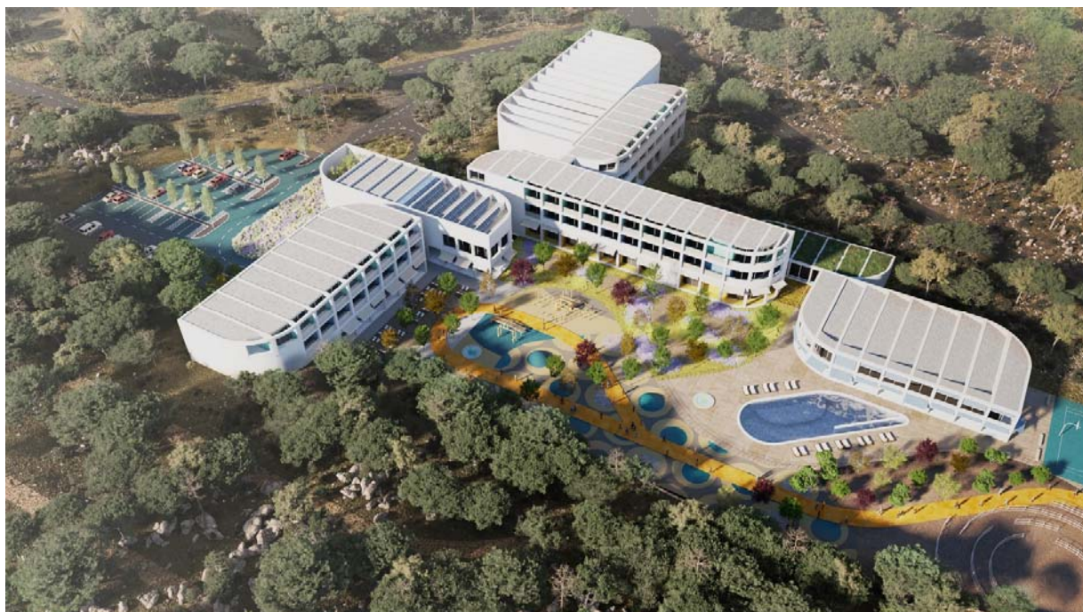
REHABILITACIJSKI CENTAR . DUGOPOLJE – pogled s juga