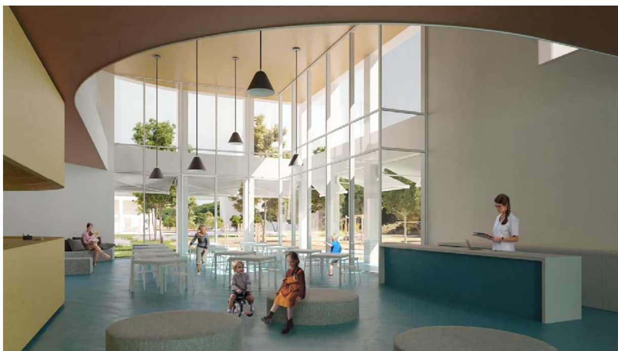
REHABILITACIJSKI CENTAR . DUGOPOLJE – predvorje, pogled prema parku