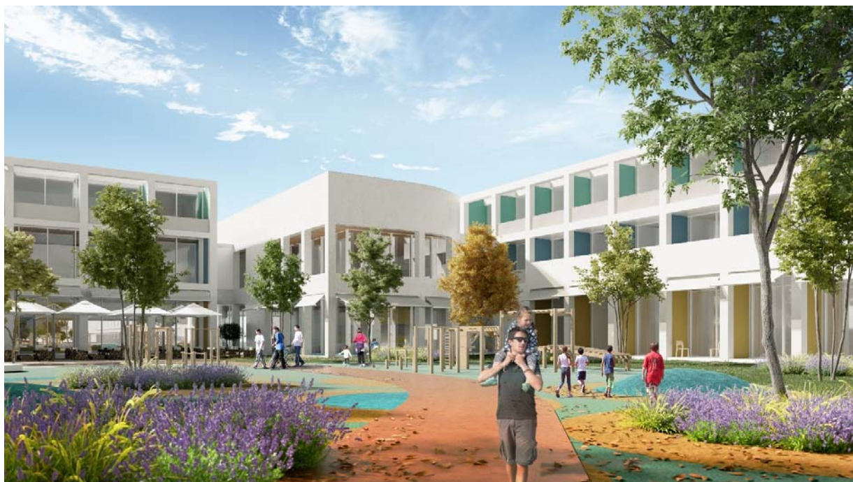
REHABILITACIJSKI CENTAR . DUGOPOLJE – pogled iz parka