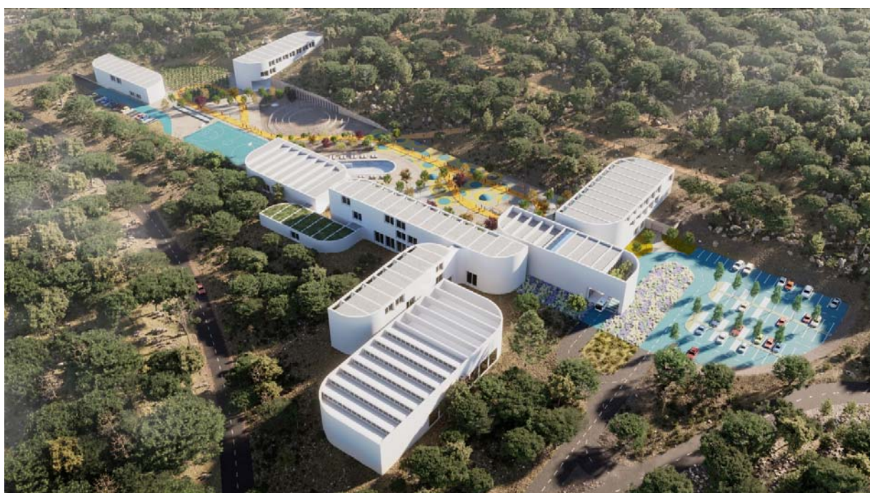
REHABILITACIJSKI CENTAR . DUGOPOLJE – pogled sa sjevera